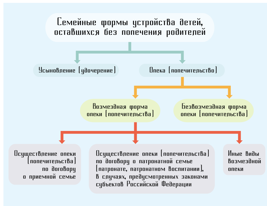
Рис. 1. Семейные формы устройства детей, оставшихся без попечения родителей, по данным Министерства образования и науки Российской Федерации

Семейное законодательство РФ предусматривает две основные формы семейного устройства (рис. 1): усыновление (удочерение) и опека (попечительство).