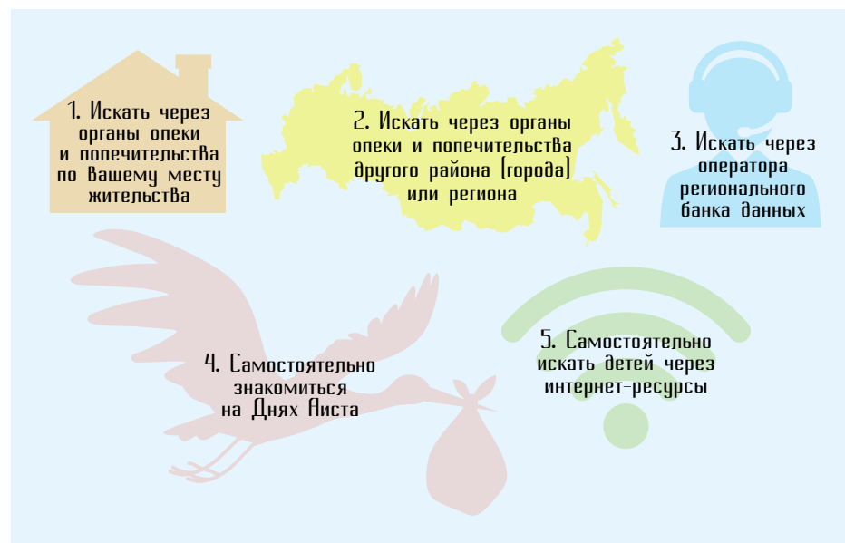
Рис. 3. Варианты подбора ребенка

Важно отметить, что достоверную информацию по этому вопросу, а также направление на посещение ребенка вам могут предоставить только органы опеки и попечительства по месту нахождения организации для детей-сирот либо оператор регионального банка данных.